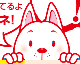
◀TECマスコット カクちゃん