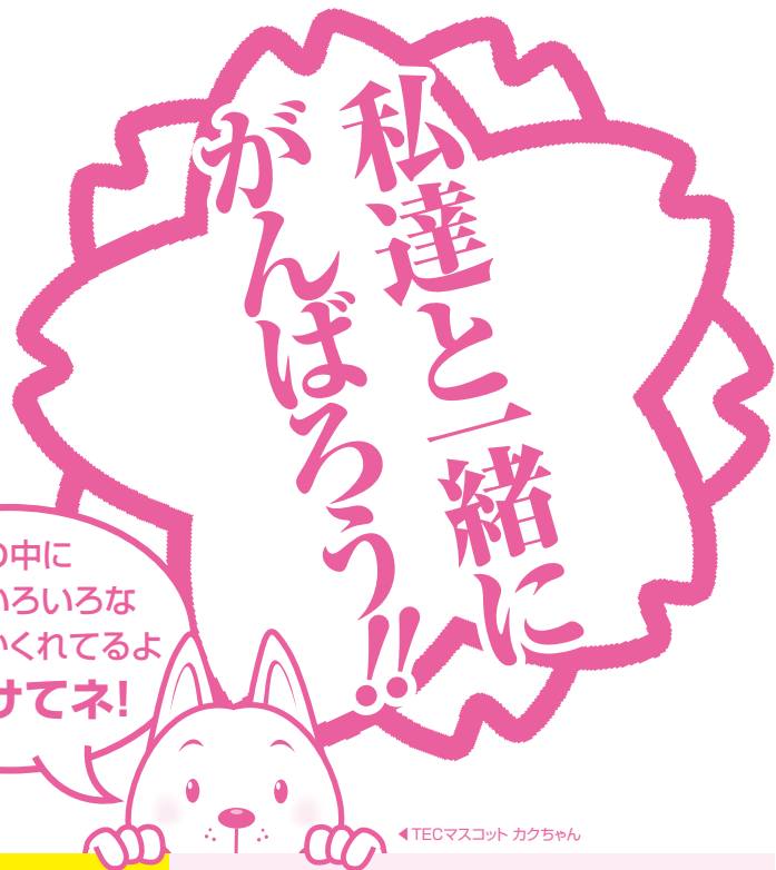
◀TECマスコット カクちゃん